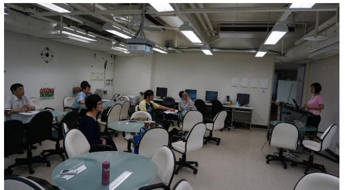
日期時間：2015.09.11 活動地點：基河校區 J501 活動說明：企業倫理工作坊_教材設計與試教