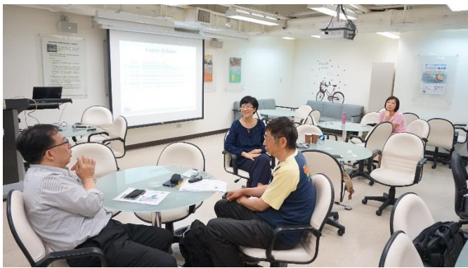
日期時間：2015.09.11 活動地點：基河校區 J501 活動說明：企業倫理工作坊_教材設計與試教