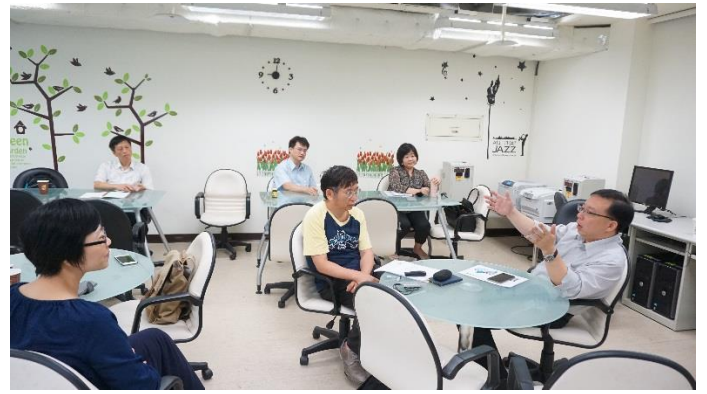
日期時間：2015.09.11 活動地點：基河校區 J501 活動說明：企業倫理工作坊_教材設計與試教