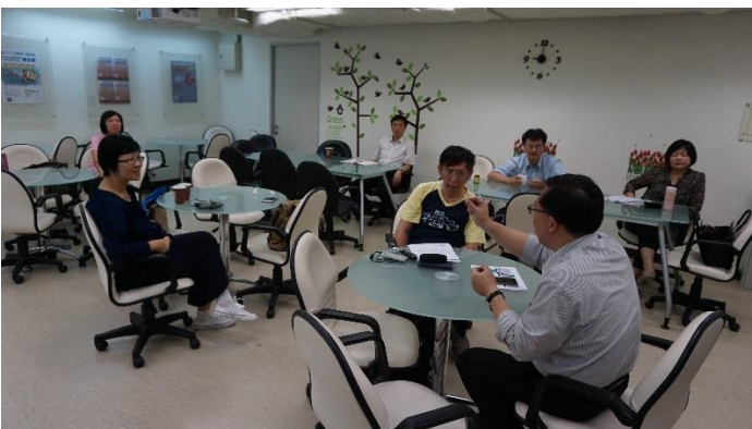
日期時間：2015.09.11 活動地點：基河校區 J501 活動說明：企業倫理工作坊_教材設計與試教