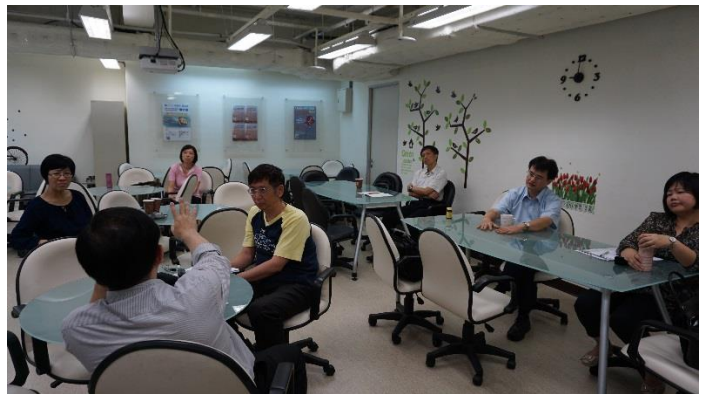
日期時間：2015.09.11 活動地點：基河校區 J501 活動說明：企業倫理工作坊_教材設計與試教