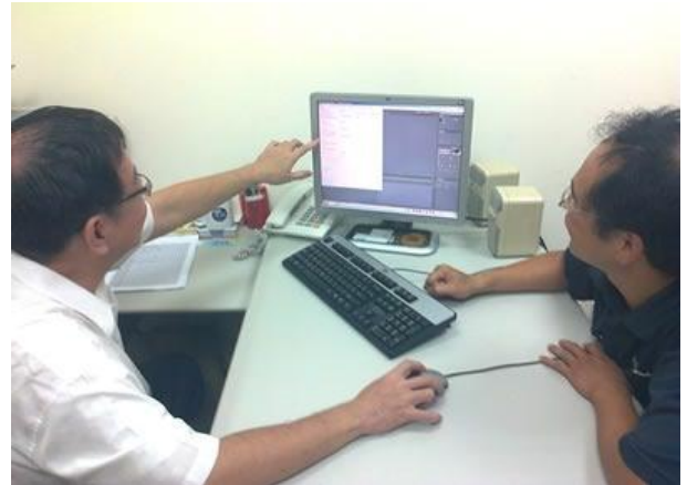
日期時間：2012/10/8 活動地點：傳院會議室 活動說明：實際操作數位影像特效製作