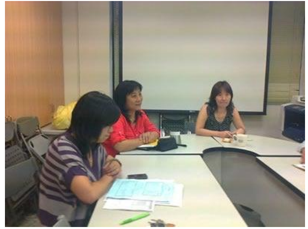
日期時間：2012/9/24 活動地點：傳院會議室 活動說明：數位影像特效製作對傳播科系學生之資訊技能需求