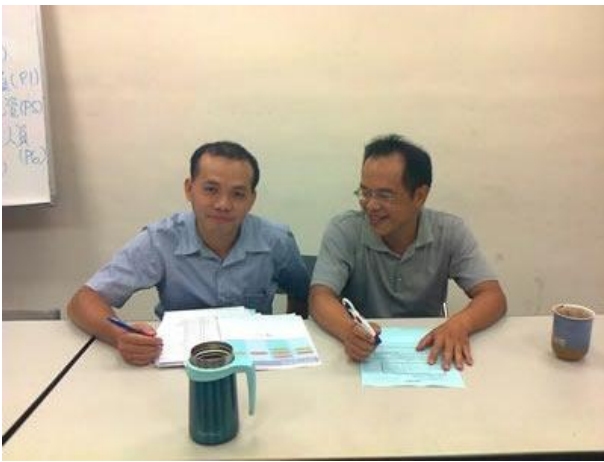
日期時間：2012/10/1 活動地點：傳院會議室 活動說明：傳播科系學生數位影像特效製作教學方式