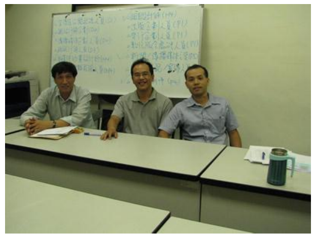
日期時間：2012/10/15 活動地點：傳院會議室 活動說明：教學方式分享