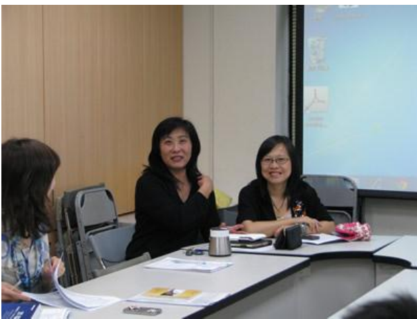
日期時間：2012/10/8 活動地點：傳院會議室 活動說明：實際操作數位影像特效製作