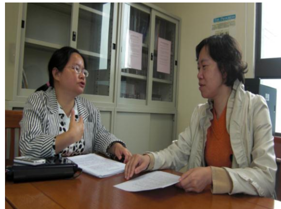
日期時間：2012.10.11 活動地點：Q508 活動說明：第四次討論