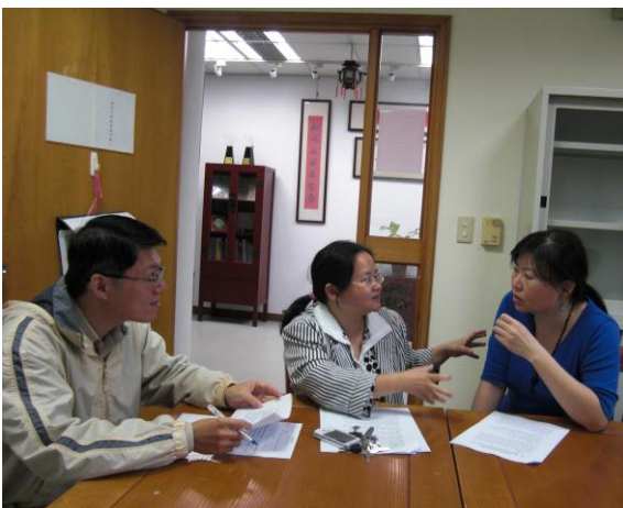
日期時間：2012.10.11 活動地點：Q508 活動說明：第四次討論