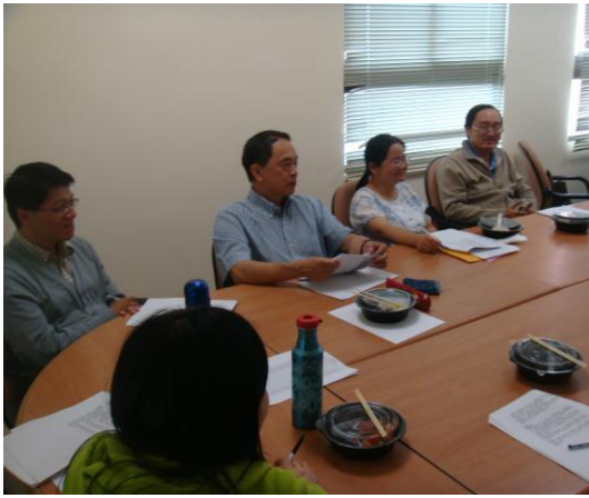
日期時間：2012.09.13 活動地點：Q513 活動說明：第一次討論