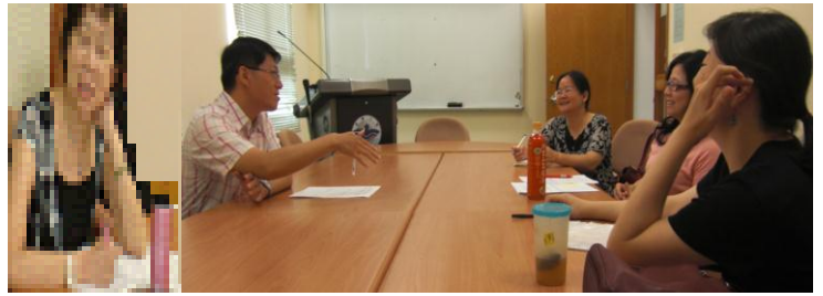
日期時間：2012.09.20 活動地點：Q513 活動說明：第二次討論