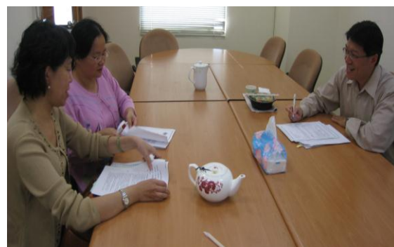
日期時間：2012.10.25 活動地點：Q513 活動說明：第五次討論