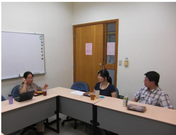
日期時間：2012.09.27 活動地點：Q524 活動說明：第三次討論