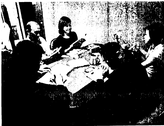
日期時間：2012/04/19 活動地點：傳播學院會議室 活動說明：教師討論共創議題