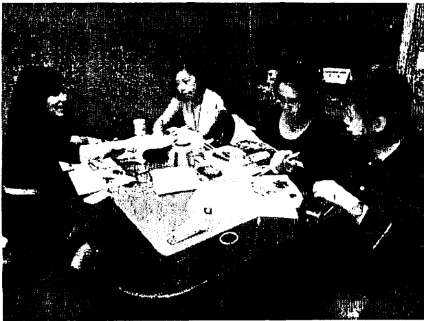
日期時間：2012/04/19 活動地點：傳播學院會議室 活動說明：教師討論策展議題