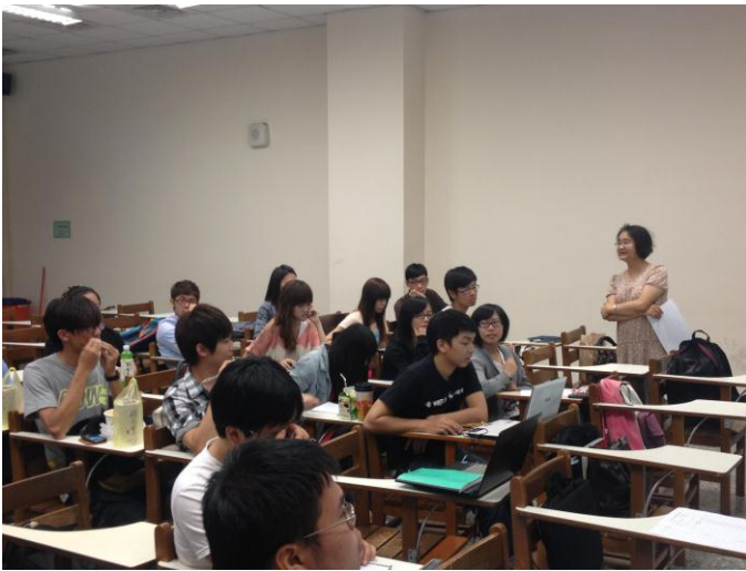
日期時間：2012/08/23 活動地點：AA601 活動說明：C#、DataBase