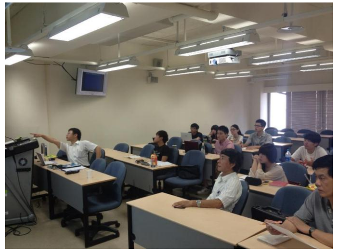
日期時間：2012/08/16 活動地點：S403 活動說明：DataBase