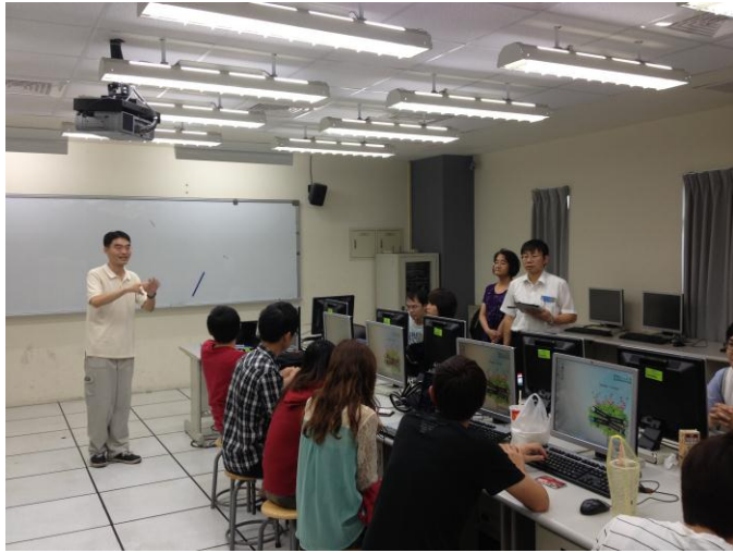
日期時間：2012/08/09 活動地點：CC502 活動說明：GAE Workshop