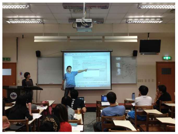
日期時間：2012/08/30 活動地點：AA602 活動說明：GAE Workshop