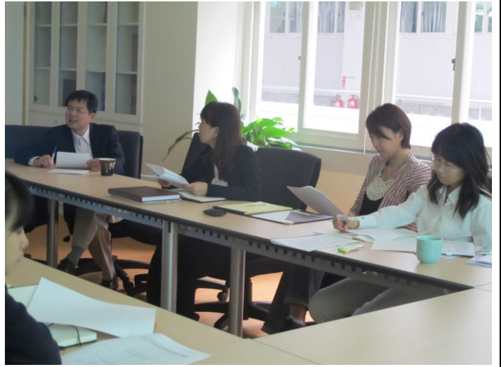
日期時間：2011/09/13 活動地點：院會議室 活動說明：教師討論