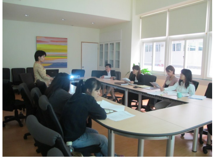
日期時間：2011/10/04 活動地點：院辦會議室 活動說明：討論會