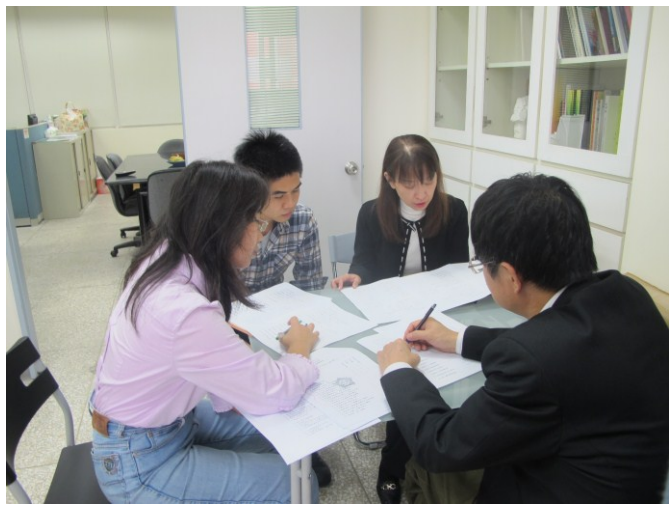
日期時間：2011/09/20 活動地點：院長辦公室 活動說明：會後討論