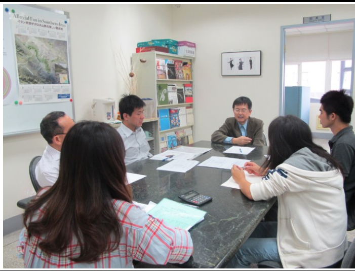
日期時間：2011/10/11 活動地點：院會議室 活動說明：會後討論