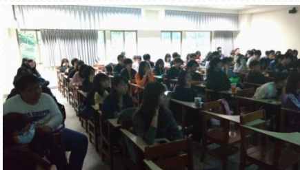
同學們聆聽教學助理報告的狀況