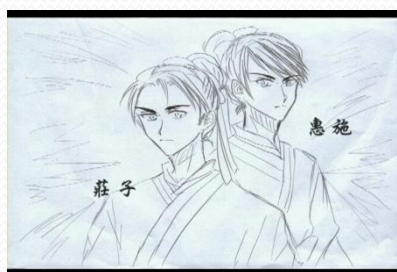
莊子與惠施自創歷史故事剪影-1