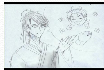
莊子與惠施自創歷史故事剪影-2