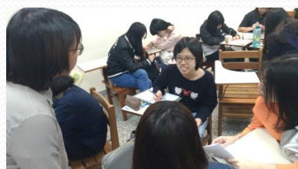
同學們課堂討論報告設計