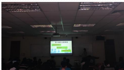
教學助理分享製作報告的經驗