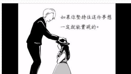
香奈兒自創歷史故事剪影-1