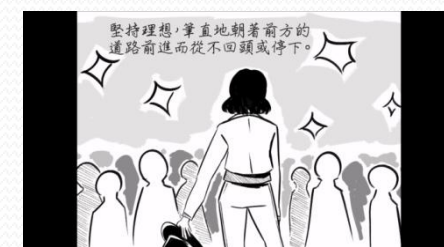
香奈兒自創歷史故事剪影-2