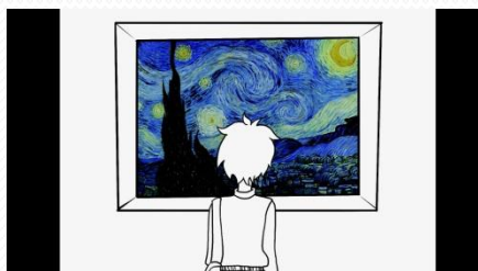
梵谷自創歷史故事剪影-1