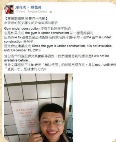
Finding awkward translation and posting on Facebook 臉書打卡翻譯活動