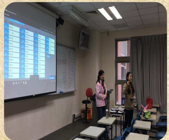
Classroom interactive teaching aids -StudyFun. 課堂即時互動教具- StudyFun.