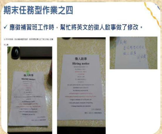
Task-based Assignment 任務型作業