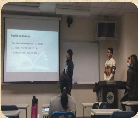
Oral Presentation 口頭報告