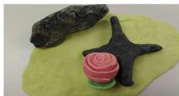
中後方的是一台車，前方是一朵玫瑰和十字架。