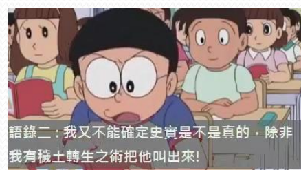
劉賀自創歷史故事影片-2