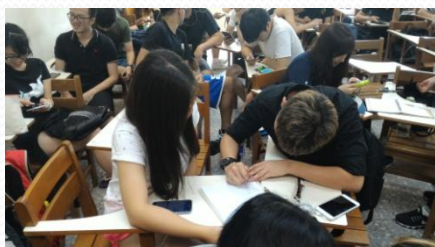
同學們課堂討論報告設計