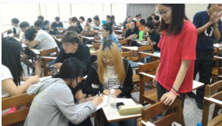
教學助理參與同學們課堂討論