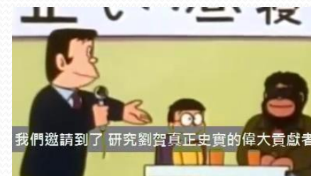
劉賀自創歷史故事影片-4