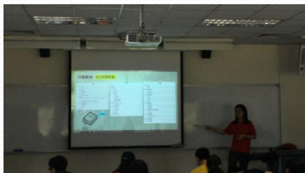
教學助理分享製作報告的經驗