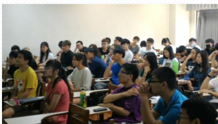
同學們聆聽教學助理報告的狀況