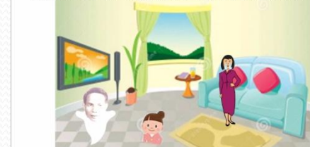
林連玉自創歷史故事影片-2