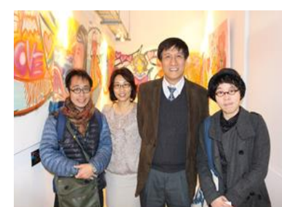
院長與藝術家及授課教師合影