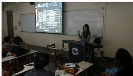
教學助理分享製作報告的經驗