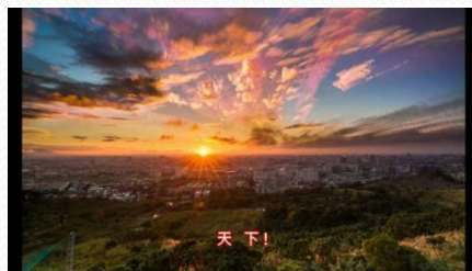
成吉思汗的影片後製-2