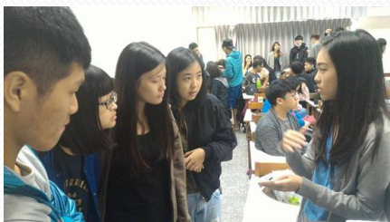
教學助理參與同學們課堂討論