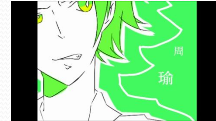
三國演義的影片後製-2