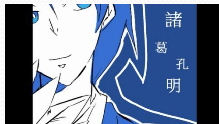
三國演義的影片後製-1