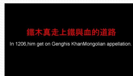
成吉思汗影片後製-1