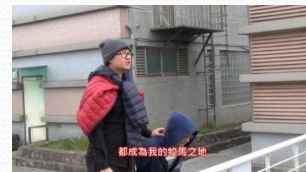
同學飾演的成吉思汗與戰馬