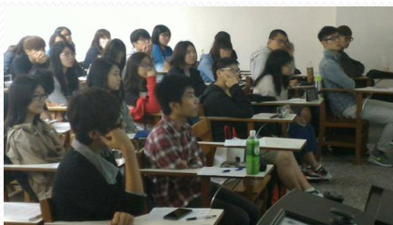
同學們聆聽教學助理報告的狀況