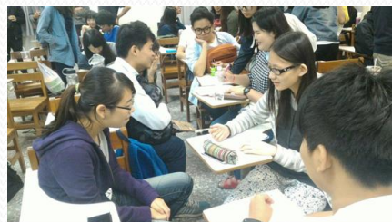
同學們課堂討論報告設計