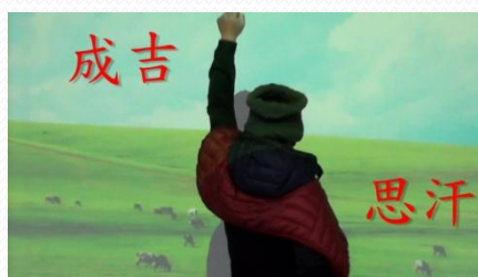
同學飾演成吉思汗