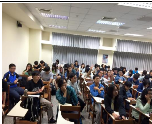
修課學生聽課實況